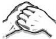
5. Kiekvienos rankos delnu trinami kitos rankos pirštai.