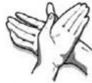
2. Dešinėsios rankos delnu trinamas kairiosios plaštakos viršus.