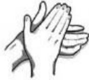
1. Delnas trinamas į delną.