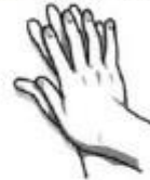
4. Suglaudžiami delnai, supinami pirštai ir trinami.