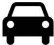
Automobilio išmetamosios dujos