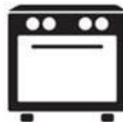
Viryklės, džiovyklės, šildytuvai